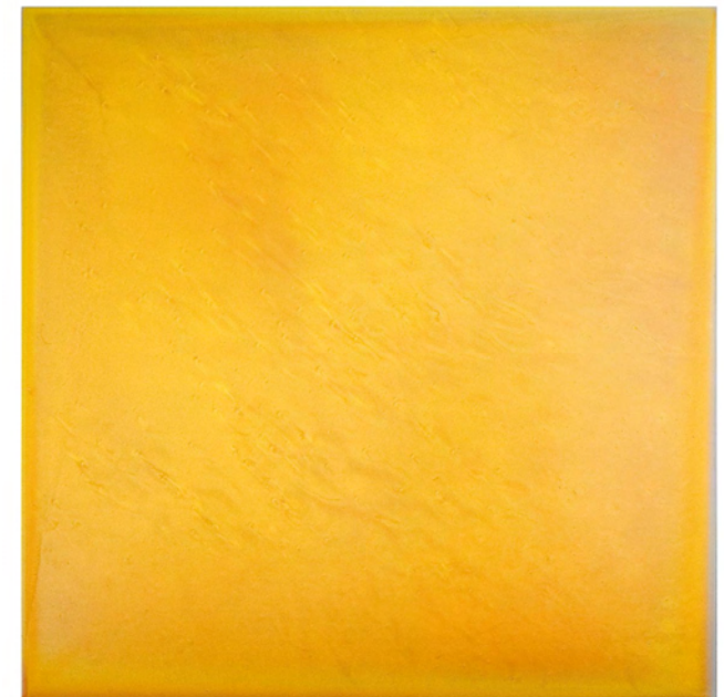
COINCIDENTIA OPPOSITORUM V, 2016, Pigment, Lack auf Aludibond, 60 x 60 cm