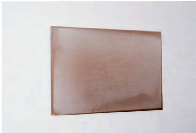
COINCIDENTIA OPPOSITORUM I, 2016, Pigment, Lack auf Aludibond, 80 x 120 cm, zwei Ansichten