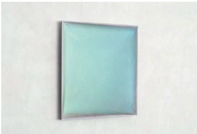
COINCIDENTIA OPPOSITORUM VII, 2016, Pigment, Lack auf Aludibond, 40 x 40 cm, drei Ansichten