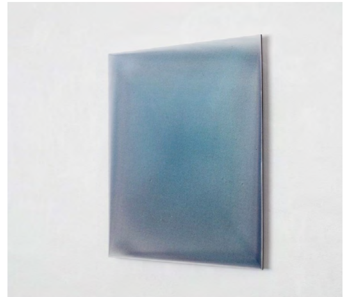
COINCIDENTIA OPPOSITORUM III, 2016, Pigment, Lack auf Aludibond, 60 x 60 cm, zwei Ansichten